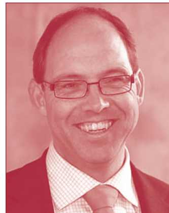
Ab Klink, minister van volksgezondheid

Begin 2009 ontvangt u de officiële uitnodiging voor de herdenkingsbijeenkomst. In de loop van de ochtend zullen we – wie wil en kan – ook een bezoek brengen aan de nabijgelegen Bomentuin waarin zich het Gedenkboek bevindt, met de 32 bijzondere bomen voor de 32 gestorven bijzondere mensen en de 200 struiken die de mensen symboliseren die in 1999 ernstig ziek werden na hun bezoek aan de Westfriese Flora.