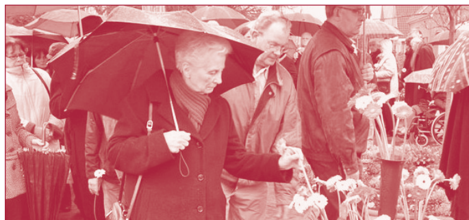
Oud-minister Borst gaf in tien jaar tijd voor de vijfde keer blijk van haar grote betrokkenheid bij alle mensen.

Deze Legionellabacterie bleek een zeer kwaadaardig type te zijn en de Flora-epidemie werd dan ook de ernstigste die de wereld tot nu toe heeft gekend, met binnen korte tijd 32 doden. Het feit dat de besmettingsbron zich op de Westfriesse Flora bevond, maakt dit drama extra aangrijpend. De Westfriesse Flora was immers al 66 jaar lang een populair jaarlijks uitstapje. Met zijn uitbundige bloemen symboliseerde de Flora het begin van de lente, van nieuw leven. Dat diezelfde Flora ook dood en verdriet kon zaaien kwam als een donderslag bij heldere hemel.